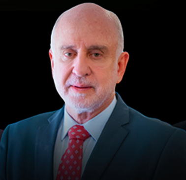
BENJAMIN ZYMLER Ministro do Tribunal de Contas da União